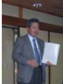
永井会員 カンボジア報告

地区のほうに申請していた寄付が75万円出ました。カンボジアの学校建設に向けて、来年はがんばりましょう。