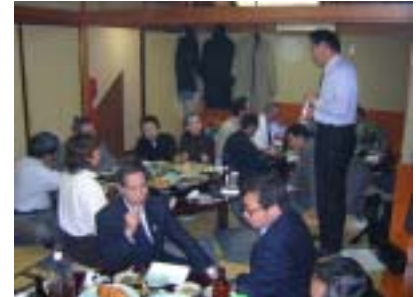
懇親会 京園の美味しい料理