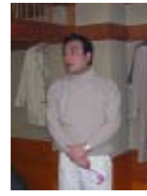
5年在会表彰 滝原会員