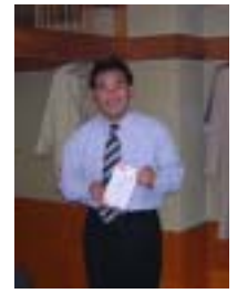
5年在会表彰 太田会員