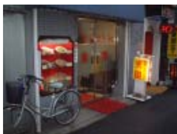
今年の最終例会 会場:京園